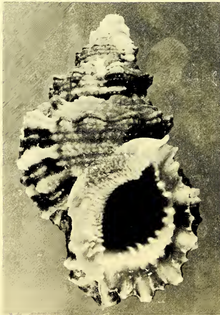
Abb. 4: Tutuſa rubeta , Unterseite, 76 mm, Daressalam